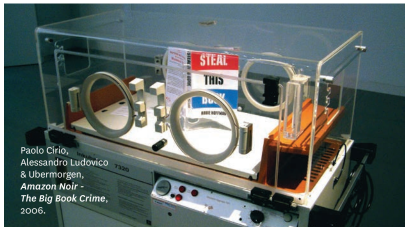
Paolo Cirio, Alessandro Ludovico & Ubermorgen, Amazon Noir - The Big Book Crime , 2006.

Nos projets visent à être à la fois des actions et des œuvres d'art. Nous les qualifions d'œuvres conceptuelles et elles sont toutes liées à l'Internet, mais il y a aussi de fortes motivations politiques en arrière-plan. Paradoxalement, nous avons également besoin d'une certaine forme de représentation physique de ces types d'action dans les institutions d'art. Par exemple, nous avons eu d'énormes retours dans la presse, pour Face to Facebook et nous avons parlé avec beaucoup de gens lors des présentations.