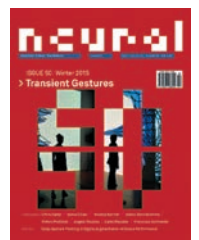
Neural #50, Transient Gesture , Winter 2015.

Alessandro Ludovico, Post Digital Print: the mutation of publishing , Onomatopoe, 2012. Neural: http://neural.it