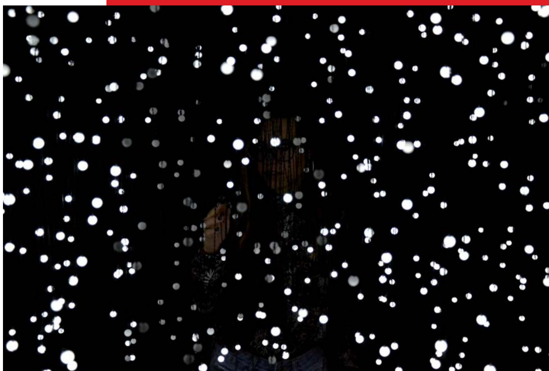
Jim Campbell, Exploded View (Commuters) , 2011, installation lumineuse

L'art au-delà du digital , Dominique Moulon, Nouvelles éditions Scala, 2018, 287 p., 320 DH